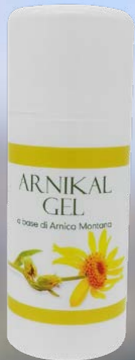
100 ml flacone airless