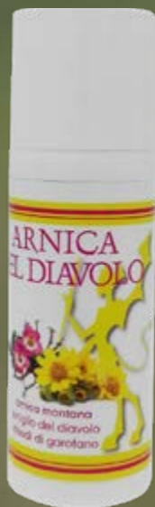
50 ml flacone airless